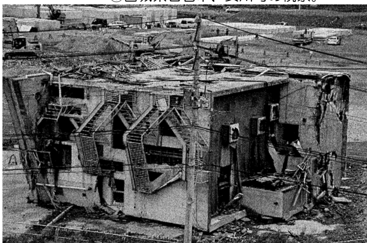
宮城県女川町 横倒しになったビル